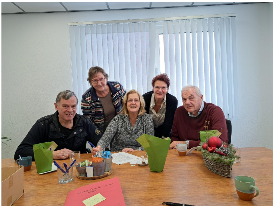
Het bestuur bij de notaris

We hopen dat u in dit plan ons enthousiasme en onze overtuiging van het belang van een groene werk- en ontmoetingsplek leest. We wensen u veel leesplezier.